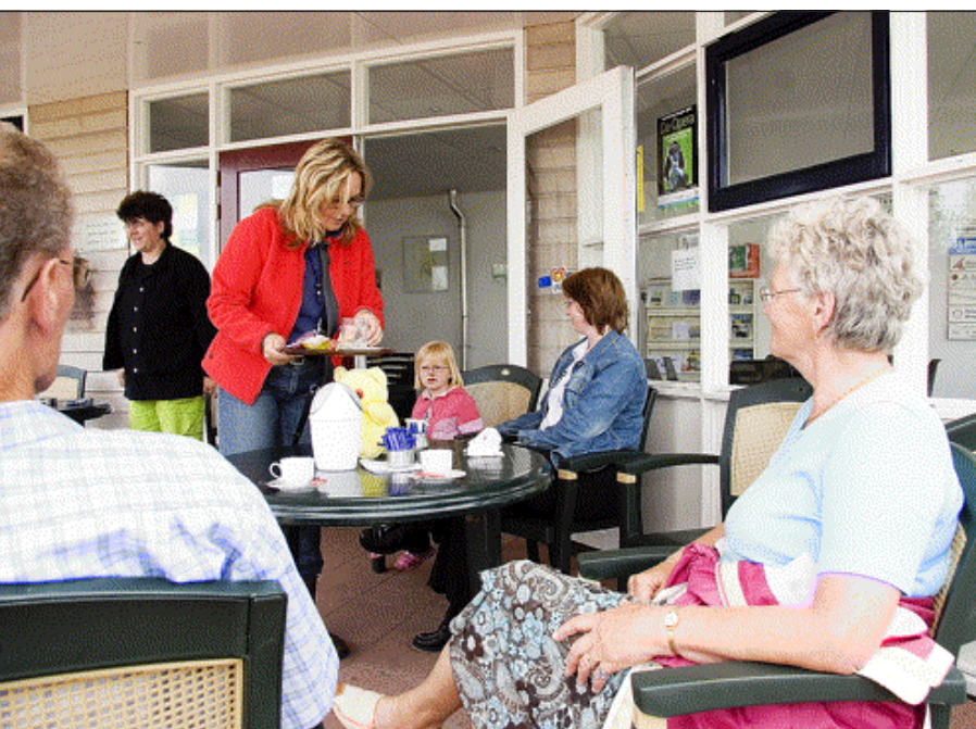
B. in een dienstbare rol.

keer over. De pont helt angstwekkend over, B. krijgt visioenen van de Herald of Free Enterprise en de Titanic. Maar de hele kerkenraad houdt droge voeten en wielen. Daarna wordt het stil, de goudglimmende bel zwijgt.