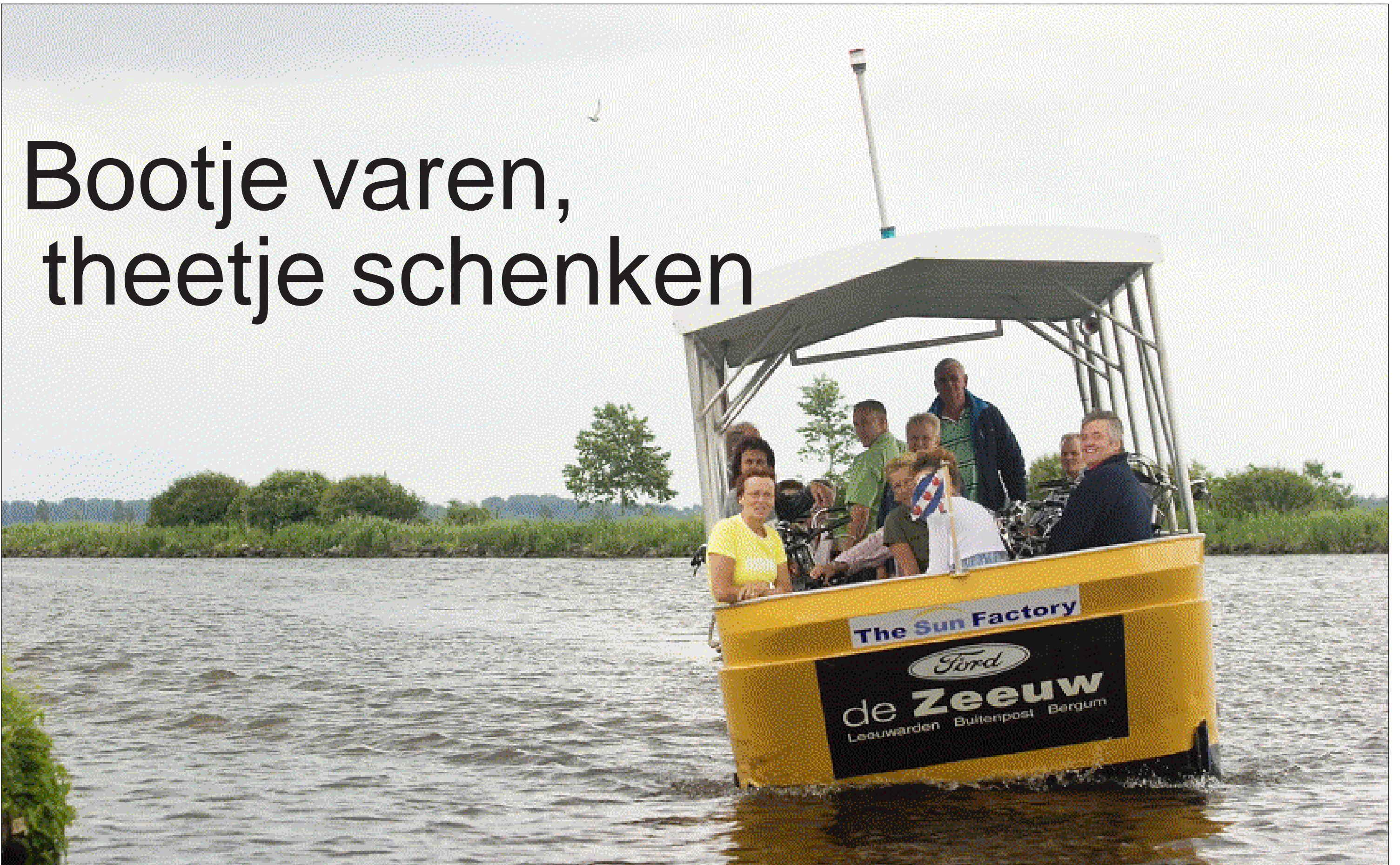
Hoewel de zonnepont flink overhelt houdt de kerkenraad van Oudega droge voeten.