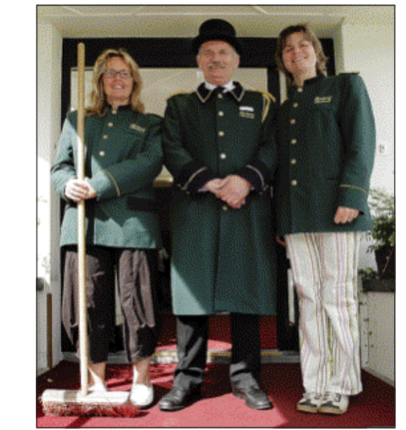
Het is groen en het staat bovenaan de trap.

In Kensington Palace wordt druk gewerkt aan een nieuw kunstwerk ter ere van de prinses: tien bloemsculpturen die lijken op de pluizenbollen