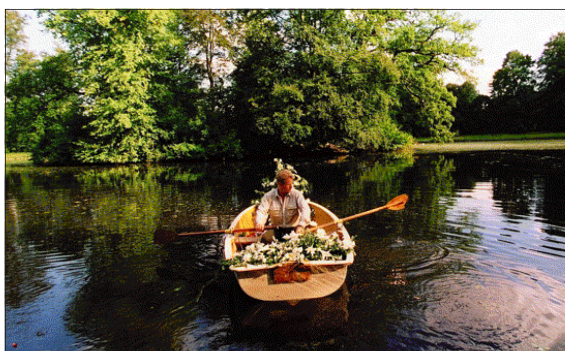
Bij het hek in Althorp achtergelaten bloemen worden naar het grafmonument van Diana gevaren.

In Londen zelf lijkt daar geen sprake van. De stad heeft de ziel van Diana gevangen en nooit meer losgelaten. Ze is overal. In de koninklijke parken