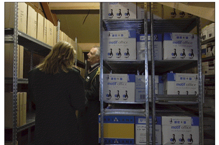
Op zolder staan jaargangen administratie op datum gerangschikt.